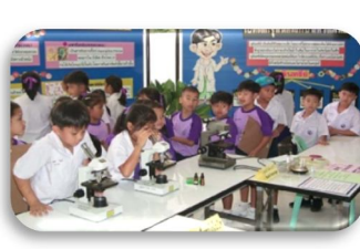
ภาพ 4 : ตัวอย่างการมีส่วนร่วม ร่วมขององค์กร การพัฒนา ชุมชนและชนบท โดย คณะศึกษาศาสตร์ และพัฒนศาสตร์