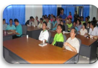
ภาพ 3 : กิจกรรม ณ ต.ทุ่งกระพังโหม