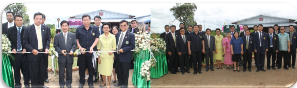
ภาพที่ 5 : วิทยาเขตเฉลิมพระเกียรติ จังหวัดสกลนคร จัดพิธีรั้บมอบโรงเรีอเน่ล่ียงไ้เก้เนื่อเพื่อการวิจั้ย จาก บริษัท เจริญโภคภัณฑ์อาหาร จำกัด (มหาชน) หรือ ซีพีเอฟ เมื่อวันที่ ๑๕ สิงหาคม พ.ศ.๒๕๕๔ ณ ฟาร์มสัตว์ปีก อุทยานเกษตร ๕๐ พรรษามหาราชราลงกรณ วิทยาเขตเฉลิมพระเกียรติ จังหวัดสกลนคร

การได้รับการสนับสนุนดังกล่าว นับว่ามีประโยชน์ในการเตรียมความพร้อมเพื่อการผลิตบัณฑิตและมหาบัณฑิต ทางด้านการผลิตสัตว์ที่มีคุณภาพ รองรับงานวิจัยของอาจารย์ บุคลากร และนิสิต อันจะนำไปสู่การปรับใช้จริงในระดับอุตสาหกรรมต่อไป อีกทั้งยังสามารถใช้เป็นแหล่งฝึกอบรมและถ่ายทอดเทคโนโลยีด้านการเลี้ยงสัตว์ปีก ให้แก่ประชาชนในพื้นที่ภาคตะวันออกเฉียงเหนือตอนบน ตามเจตนารมณ์ของมหาวิทยาลัยเกษตรศาสตร์และรัฐบาลในการขยายโอกาสทางการศึกษาไปสู่ภูมิภาคตะวันออกเฉียงเหนือตอนบน