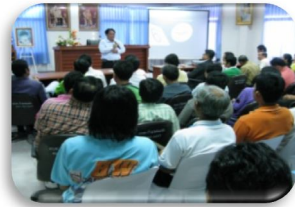
ภาพ 1 : กิจกรรม ณ ต.กำแพงแสน