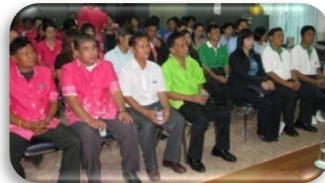
ภาพ 2 : กิจกรรม ณ ต.ทุ่งบัว