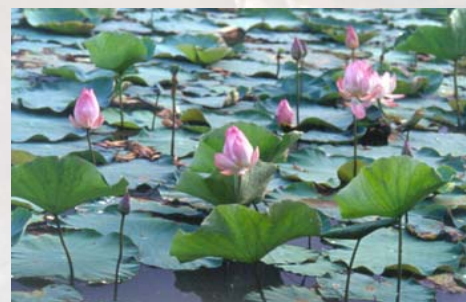
Nelumbo nucifera Gaertn.

มูลนิธิสวนหลวง ร.๙ สวนพฤกษศาสตร์สมเด็จพระนางเจ้าสิริกิติ์ มูลนิธิวิทยาศาสตร์การเกษตร มหาวิทยาลัยเกษตรศาสตร์ ชมรมผู้รักบัวแห่งประเทศไทย International Waterlily & Water Gardening Society (IWGS)