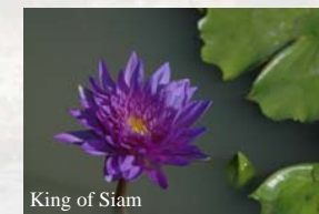
King of Siam