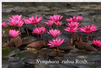
Nymphaea rubra Roxb.

และมีการบรรยายในหัวข้อ การปรับปรุงพันธุ์ การใช้ประโยชน์และการตลาด