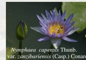
Nymphaea capensis Thunb. var. zanzibariensis (Casp.) Conard